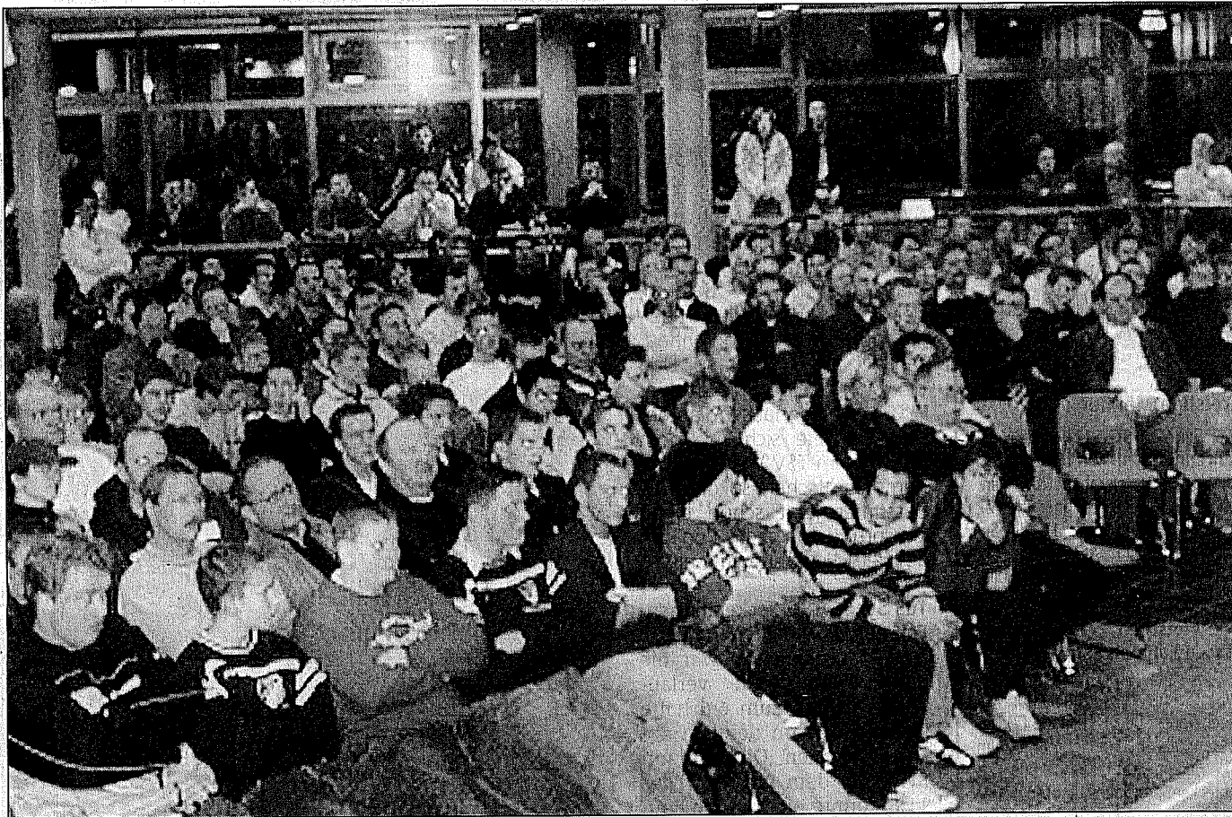
Riesiges Interesse: Über 400 Zuhörer verfolgten die Podiumsdiskussion in den BBS Diepholz.