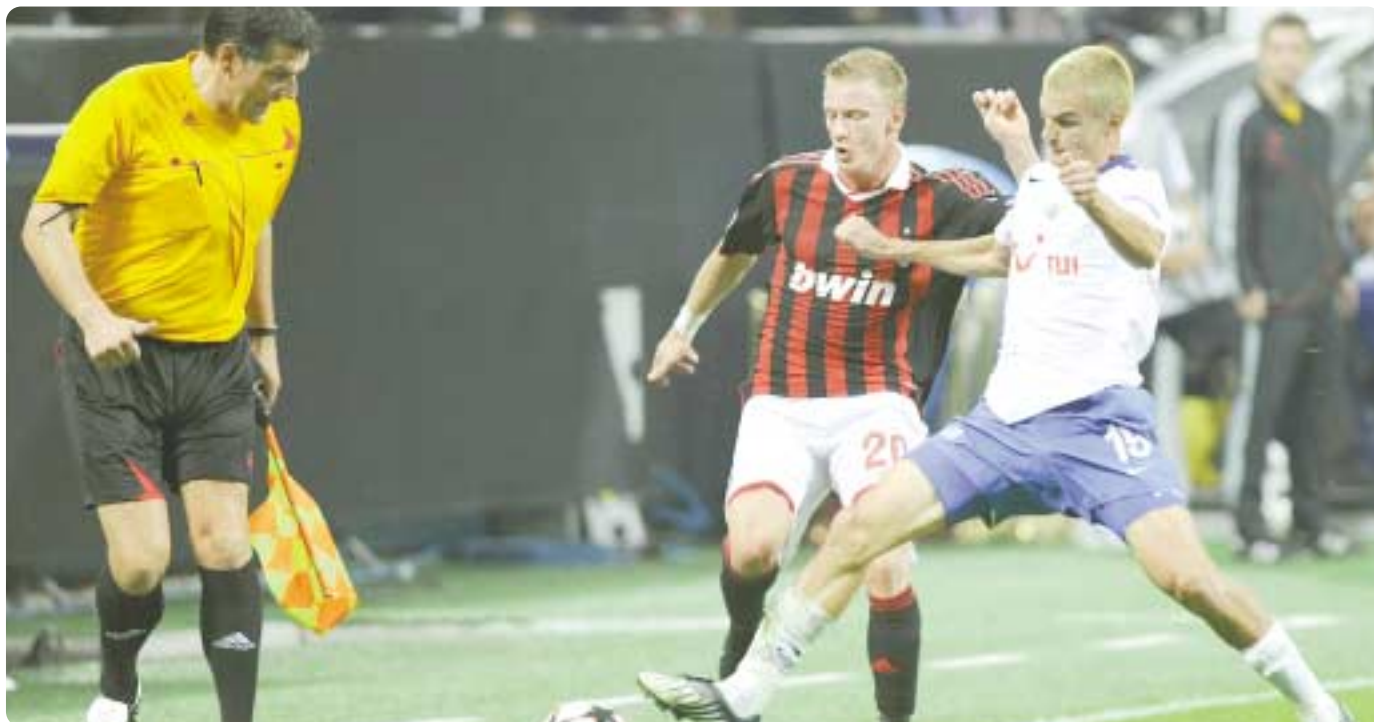
... beim Champions League Spiel am 30. September AC Mailand gegen FC Zürich.