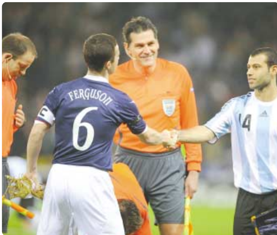
... beim Freundschaftsspiel am 19. November Schottland gegen Argentinien. Rechts Argentinien's Kapitän Javier Masche Rano.